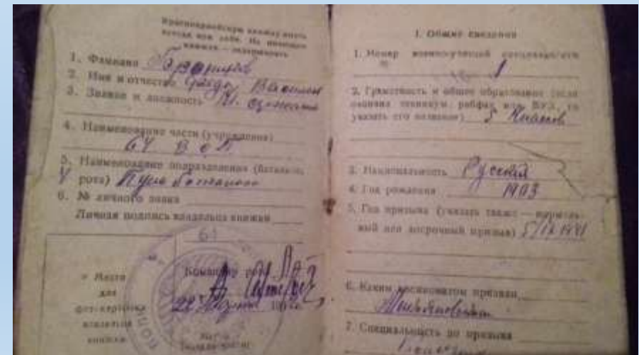
Военный билет, награды Бронникова Ф.В.